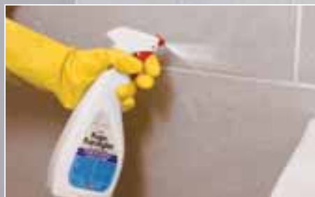
Lip Fugeforsegler sprayeres på. Lad det stå ca. 1 time og tør overskydende fugeforsegler af med en klud.