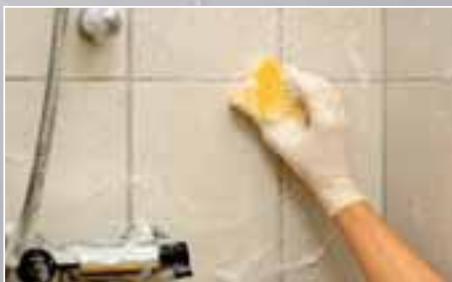
Sæberester m.m. fjernes med LIP Grundrens. Underlaget fugtes, hvorefter rengøring foretages.