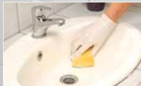
Alt sanitet vaskes med LIP Sanitetsrens, der modvirker og fjerner lettere kalkansamlinger.